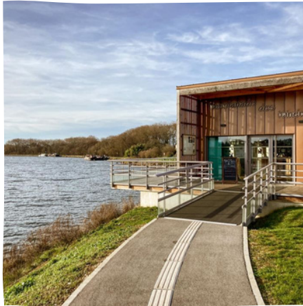
OFFICE DE TOURISME Esplanade des Itinérances Quai Lafayette 21170 SAINT-JEAN-DE-LOSNE Tél. +33 (0)3 80 37 15 70